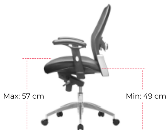
Altura máxima y mínima del asiento

Sistema up & down , el cual permite subir o bajar la altura de la silla a traves de un pistón neumático, que le facilitará posicionarse en la altura deseada o de acuerdo a la estatura de cada usuario.